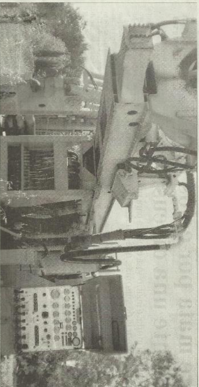
La máquina perforadora de 600.000 euros adquirida en 2001 lleva años abandonada en un solar de Campos.

«La subida de tasas aéreas está teniendo efectos demotivadores sobre el turismo español», aseguró Zorreda, quien apuntó que sólo entre octubre y noviembre del año pasado se perdieron otros 2,5 millones de pasajeros aéreos. El lobby turístico ya avisó en octubre que la subida de tasas aéreas afectaría al 77% de las entradas de turistas extranjeros al año, un impacto que también se nota en el turismo nacional —que supone el 50% de la actividad turística— ya que el 40-50% de los españoles